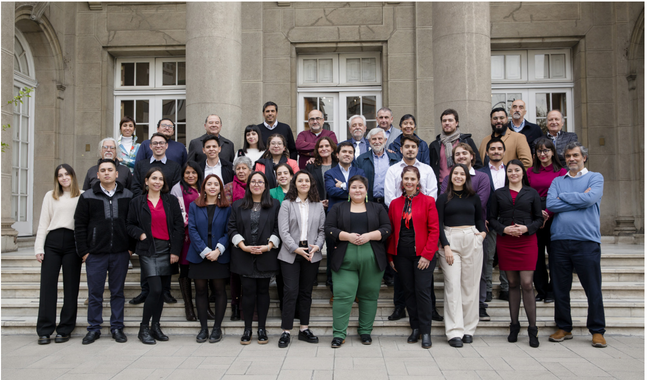
Fotografía de profesionales y colaboradores(as) CSP, mayo 2023

ciencias sociales, ciencia política y comunicación estratégica. Contamos con una red de colaboradores y colaboradoras con amplia experiencia en los distintos ámbitos de interés público en los que trabajamos.