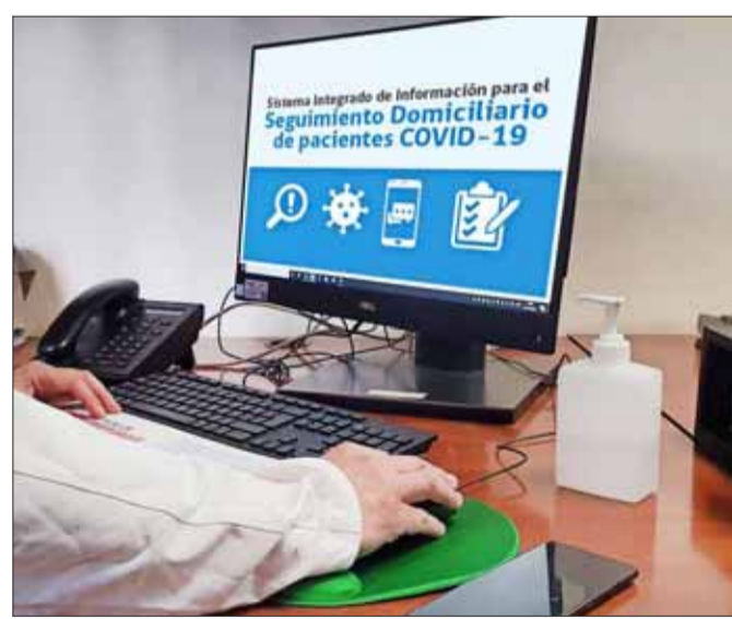
Inteligencia artificial es la principal herramienta con la que funciona el sistema de monitoreo.

En promedio, cerca del 60% de los consultados declara no tener síntomas. Así, la herramienta disminuye en ese mismo porcentaje las llamadas diarias del personal médico dedicadas a esta labor, lo que permite liberar tiempo para un seguimiento más personalizado a pacientes de riesgo al-